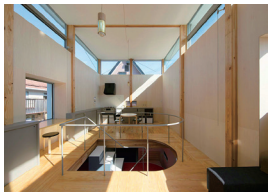
CLERESTORY HOUSE 有吉弘輔 ノットイコール一級建築士事務所