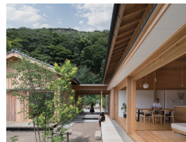
p19・p68-69 ※ 9