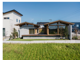
p21・p72-73 ※ 11