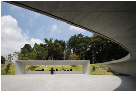
p07・p44-45 ※ 2

福岡市立平尾霊園合葬式墓所 木下昌大・山崎雅嗣・菊地崇寛 (株)キノアーキテクツ