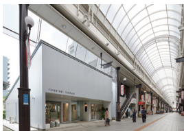
TAKENISHI TERRACE 田中悠希・榎本亮祐 Y RAD