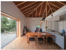
p11・p52-53 ※ 1

島の家 001 水谷元・三宅唯弘・満田衛資 水谷元建築都市設計室 / 三宅唯弘建築設計事務所 / 満田衛資構造計画研究所