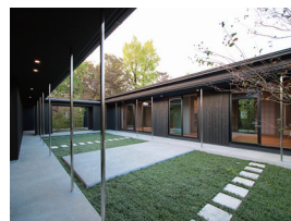
p20・p70-71 ※ 10