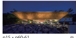
p15・p60-61 ※ 1

花西海 坂口佳明・坂口舞・井佐子恵也 (有)設計機構ワークス 長崎県東彼杵郡波佐見町