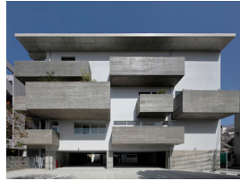
沖縄県教育会館 山口瞬太郎・五十嵐敏恭 (株)山口瞬太郎建築設計事務所 / STUDIO COCHI ARCHITECTS