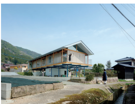
p12・p54-55 ※ 5