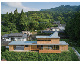
p13・p56-57 ※ 6