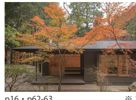
p16・p62-63 ※ 1

花西海 坂口佳明・坂口舞・井佐子恵也 (有)設計機構ワークス 長崎県東彼杵郡波佐見町