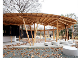
p14・p58-59 ※ 5

森と人の輪 立田山憩の森・お祭り広場公衆トイレ 曾根拓也・坂本達典・内村梓・前原竹二 山下設計