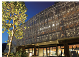
奄美市役所 岳川裕介・福田紘史・重信健次郎・重信千代乃 内藤建築事務所 / 重信設計