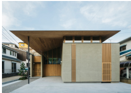
長与の家 新田崇博・外尾昂之 class archi (株)