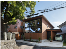
p08・p46-47 ※ 3