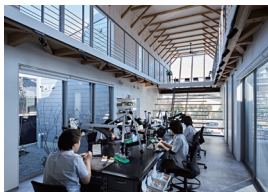
渡鹿のオフィス 志垣孝行・井上遼太・中村安那・塩崎奈都子 志垣デザイン店