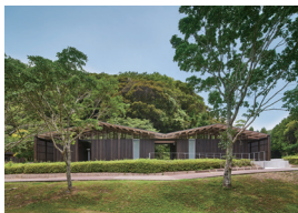
神話の里トイレ 田中健一郎・山下優子 (株)三省設計事務所