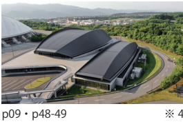
p09・p48-49 ※ 4

昭和電工(大分県立)武道スポーツセンター 能勢修治・浜橋正・長田純一・原健一郎・山田憲明 石本建築事務所 / 山田憲明構造設計事務所