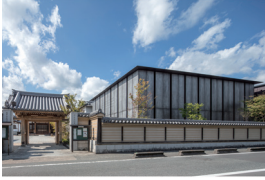
p06・p42-43 ※ 1