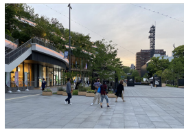
熊本都市計画桜町地区第一種市街地再開発事業 杉山俊一・高橋央・甚内有紀・藤田健児・福田達也 日建設計 / 太宏設計