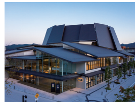
p18・p66-67 ※ 8