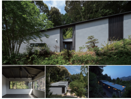
森縁の家 青木仁敬 (株)仁設計