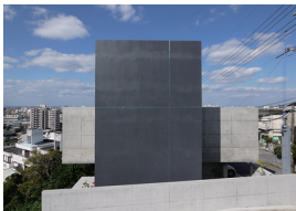
Casa di Y 金城優・金城裕美子 (有)門