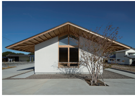
松島搦の住宅 高城聡嗣 Takashiro Architects