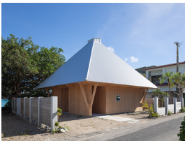
p10・p50-51 ※ 1