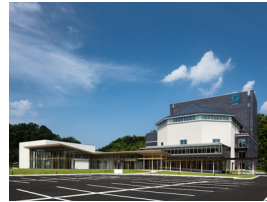
p17・p64-65 ※ 7