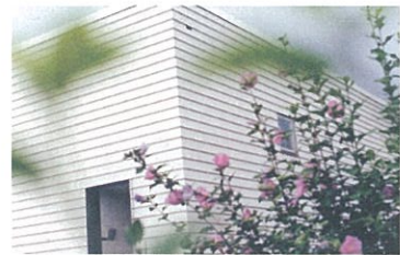
film 5. 2004 (2006年竣工)