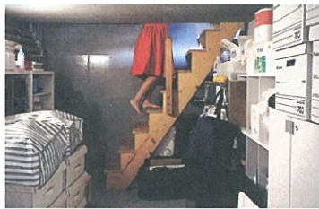
film 4. 家と道 (2013年竣工)

監督：岡田栄造、空間現代 音楽：空間現代 街かどに吊るされた高さ7.5メートルのカーテン。その奥に続く、どこかで見たホテルの廊下のような空間。そこにある生活の断片が、静止画のようになり切り取られます。