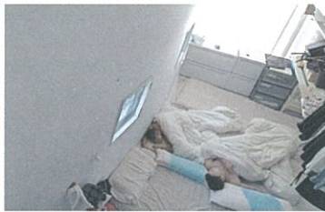
film 3. O邸 (2009年竣工)

(2018年竣工) カメラ：江口宏志 企画：川村真司 人の来なくなってしまった薬草園を、果物と薬草を使った蒸留所に生まれ変わらせる計画。動き始めたばかりのお酒造りを1人称カメラが見つめます。