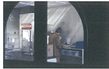
film 1. 弦と弧 (2017年竣工)