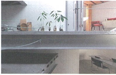
film 1. 弦と弧 (2017年竣工)