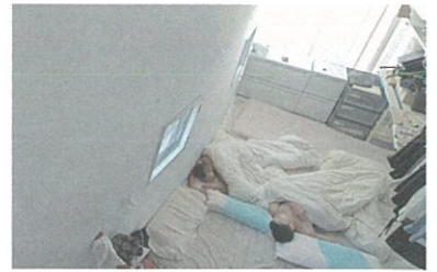
film 3. 岡田邸 (2009年竣工)

(2018年竣工) カメラ：江口宏志 企画：川村真司 人の来なくなってしまった薬草園を、果物と薬草を使った蒸留所に生まれ変わらせる計画。動き始めたばかりのお酒造りを1人称カメラが見つめます。