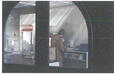
film 2. mitosaya 薬草園蒸留所

2階建ての大きさに、かたちのばらばらな10層の平面が重なった住居兼仕事場。上下するカメラが、その場所での朝から晩までを記録します。