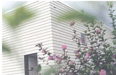
film 5. 2004 (2006年竣工)