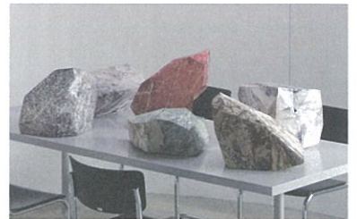
film 6. かみのいし (2019年)

監督：YU SORA 音楽：庄子 涉 住宅街に取り残されたクローバーの生えた地面と、その上に50センチだけ持ち上げられた白い木箱のような家。アニメーションとスライドショーによる短編。