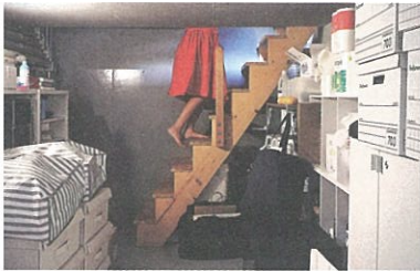
film 4. 家と道 (2013年竣工)

監督：岡田栄造、空間現代 音楽：空間現代 街かどに吊るされた高さ7.5メートルのカーテン。その奥に続く、どこかで見たホテルの廊下のような空間。そこにある生活の断片が、静止画のように切り取られます。